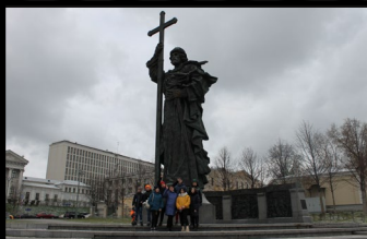
Город-герой Москва. Памятник Владимиру Крестителю