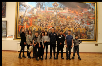
Музей Ильи Глазунова (художника-патриота Родины)