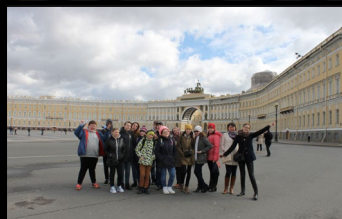
Город-герой Ленинград Дворцовая площадь

Знакомство с городами позволило более полно представить размеры военных событий, оценить масштабы разрушений, лично ознакомиться с памятниками истории и архитектуры, историей подвига своего народа, определить характерные особенности того или иного города, которые легли в основу будущих выставочных композиций.