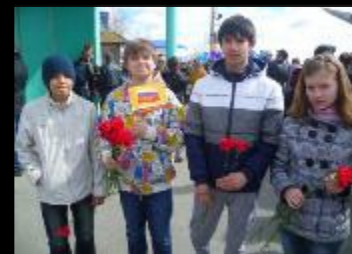
Парад Победы. Поздравление ветеранов