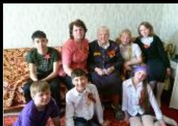
В гостях у ветеранов тыла