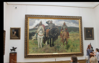
г Москва. Третьяковская галерея