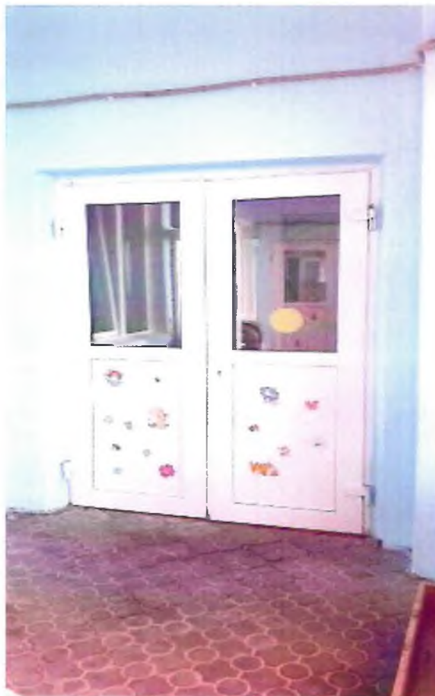
Фото 6. Вход в здание на право