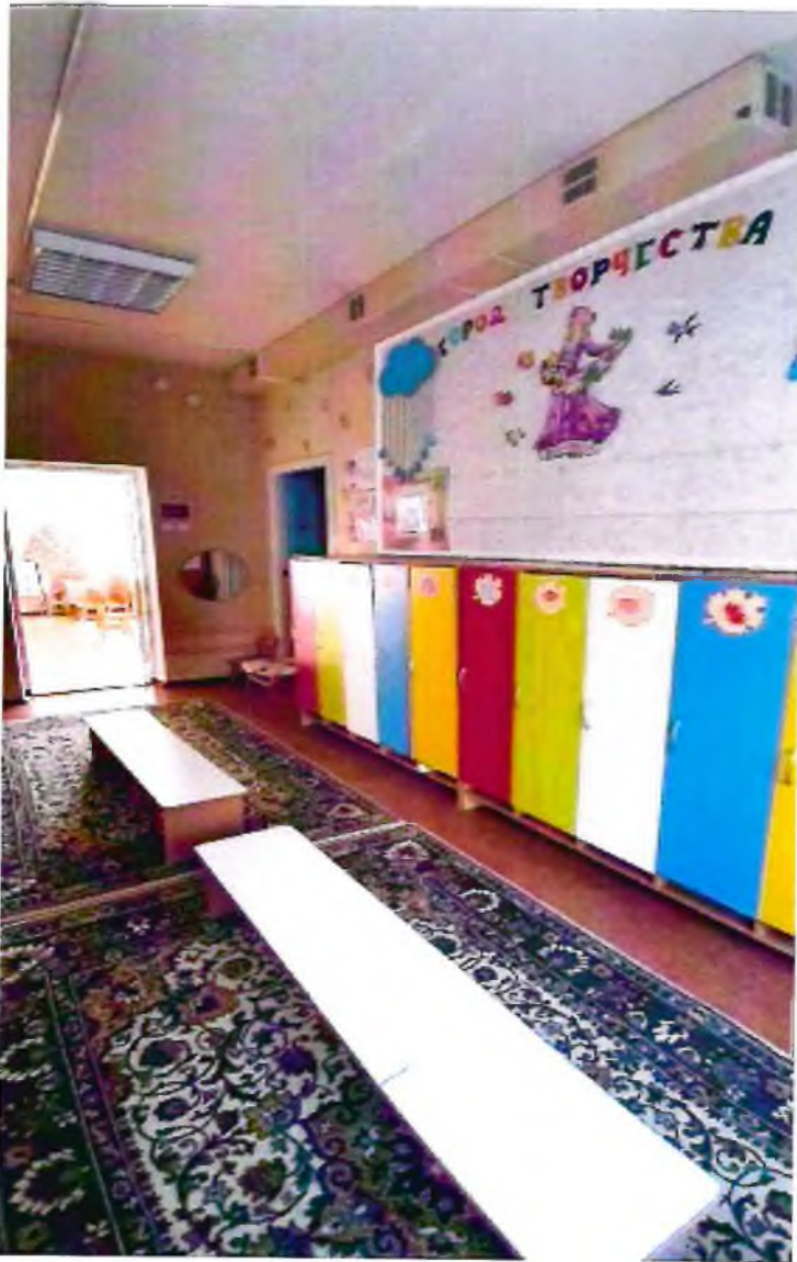
Фото 13. Зона целевого назначения (спальня)