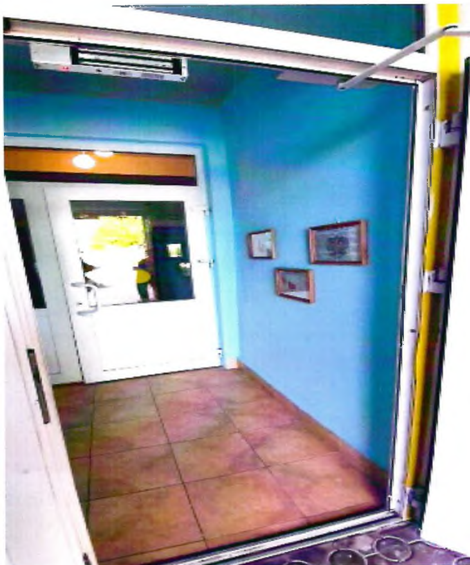
Фото 8. Вход в здание (тамбур)