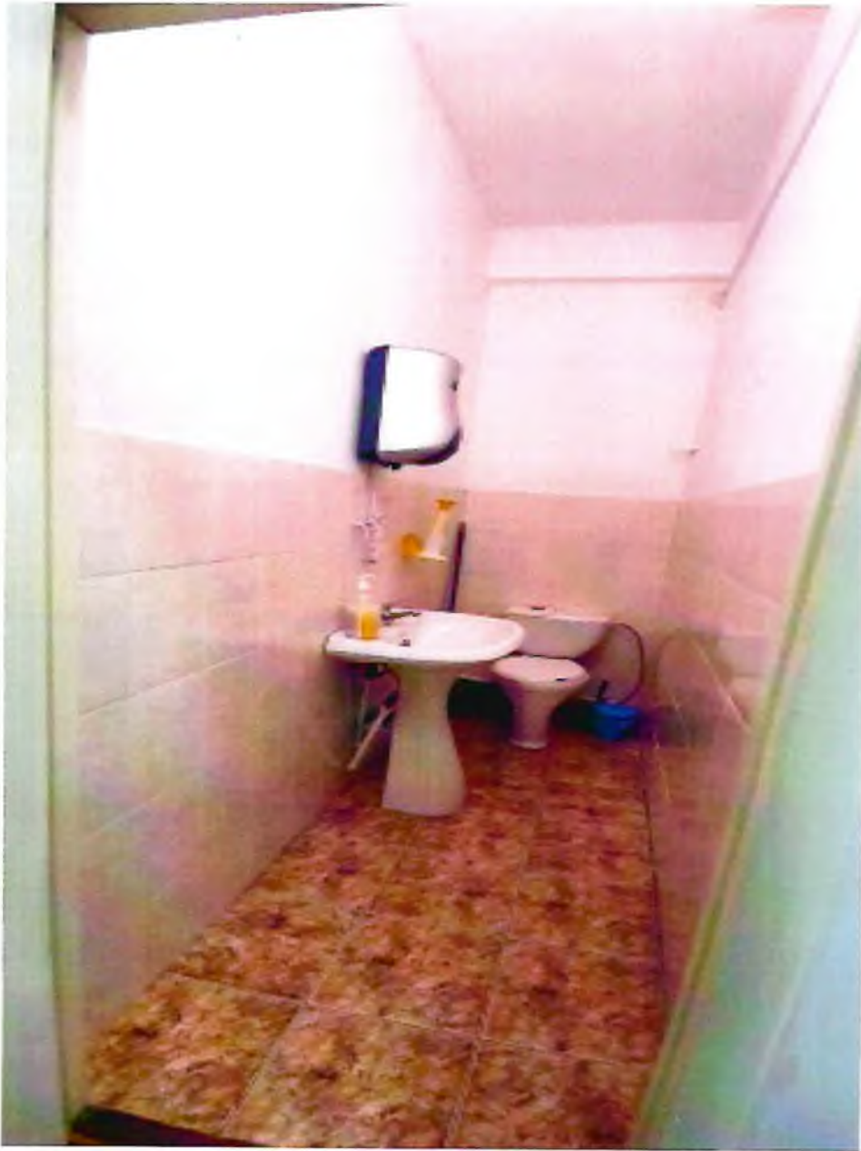
Фото 15. Санитарно-гигиеническое помещение