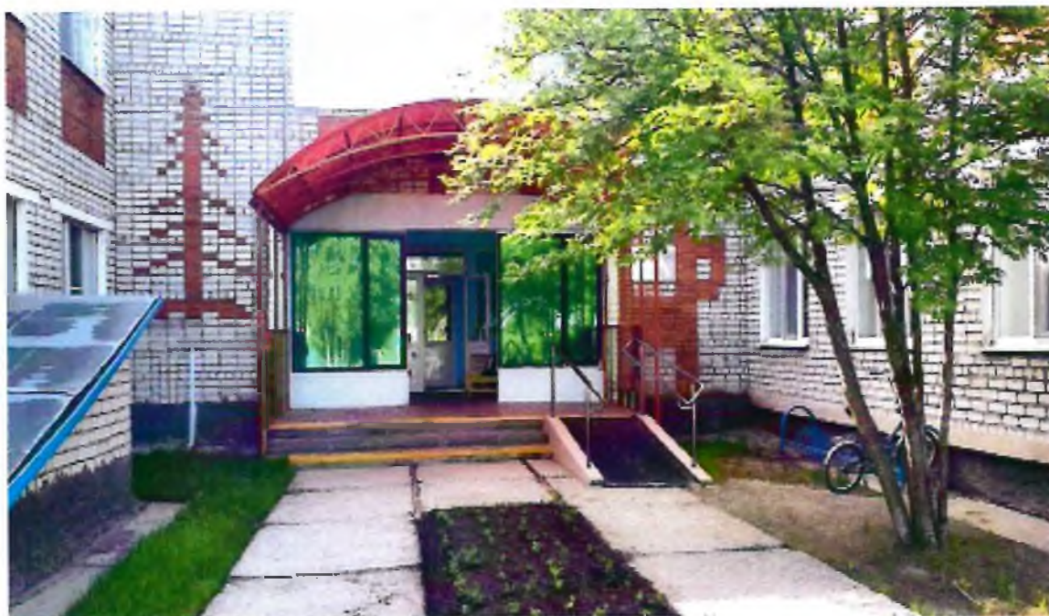
Фото 3. Вход (входы) в здание. Центральный вход, ул. Таежная д.27