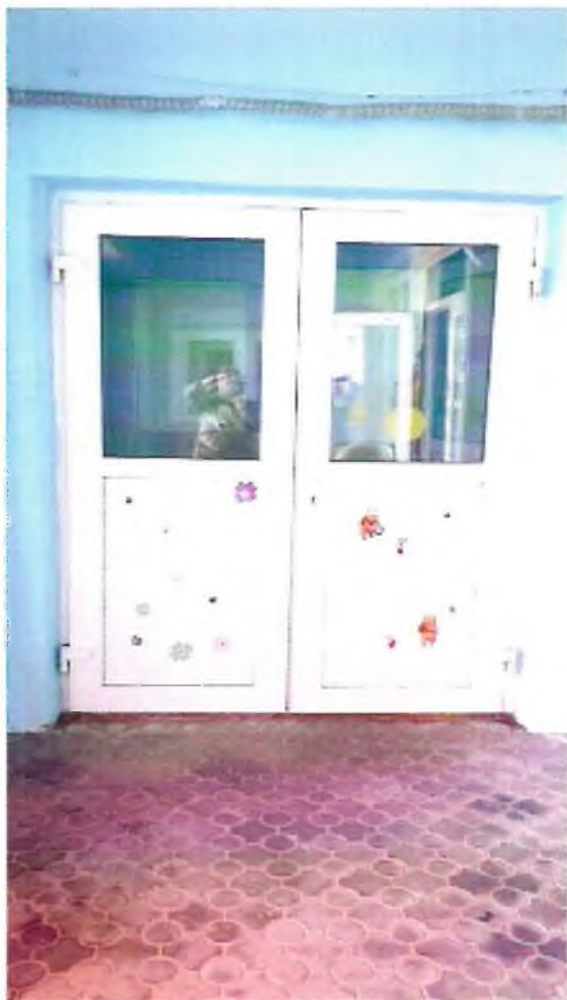
Фото 5. Вход в здание на лево