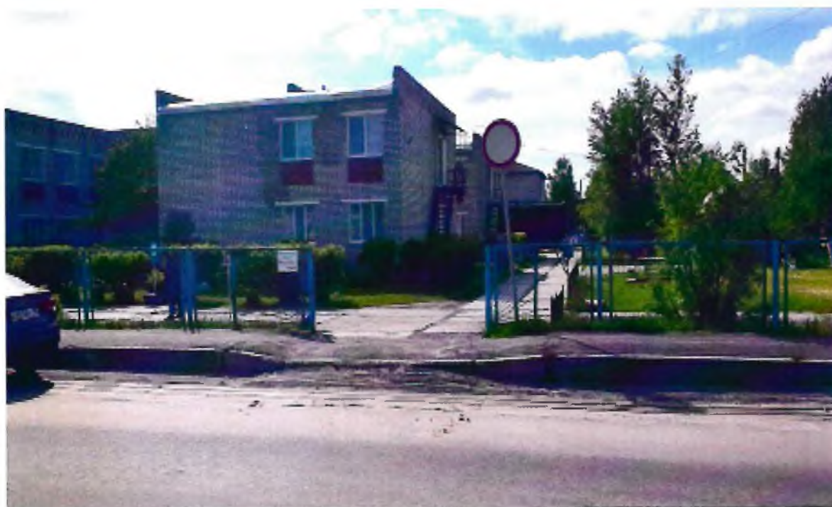
Фото 4. Вход (входы) в здание. Центральный въезд, ул. Таежная д.27