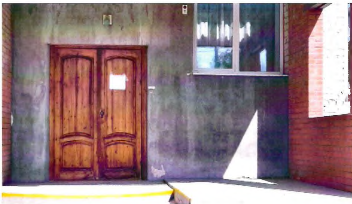
Фото 7. Вход в здание 2-го корпуса