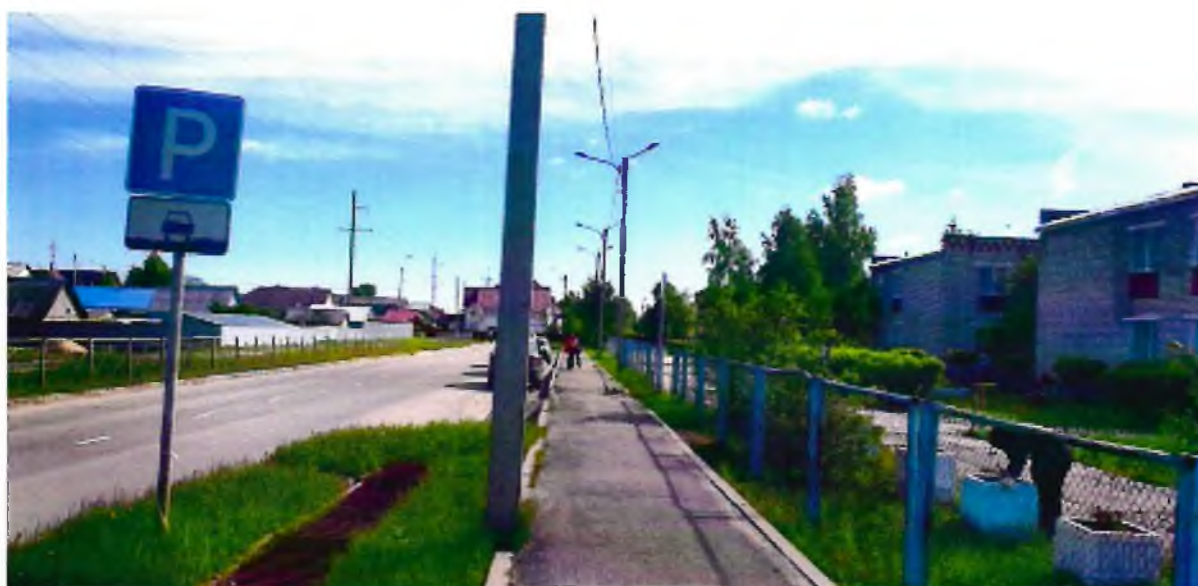
Фото 2. Территория, прилегающая к зданию (автостоянка и парковка)