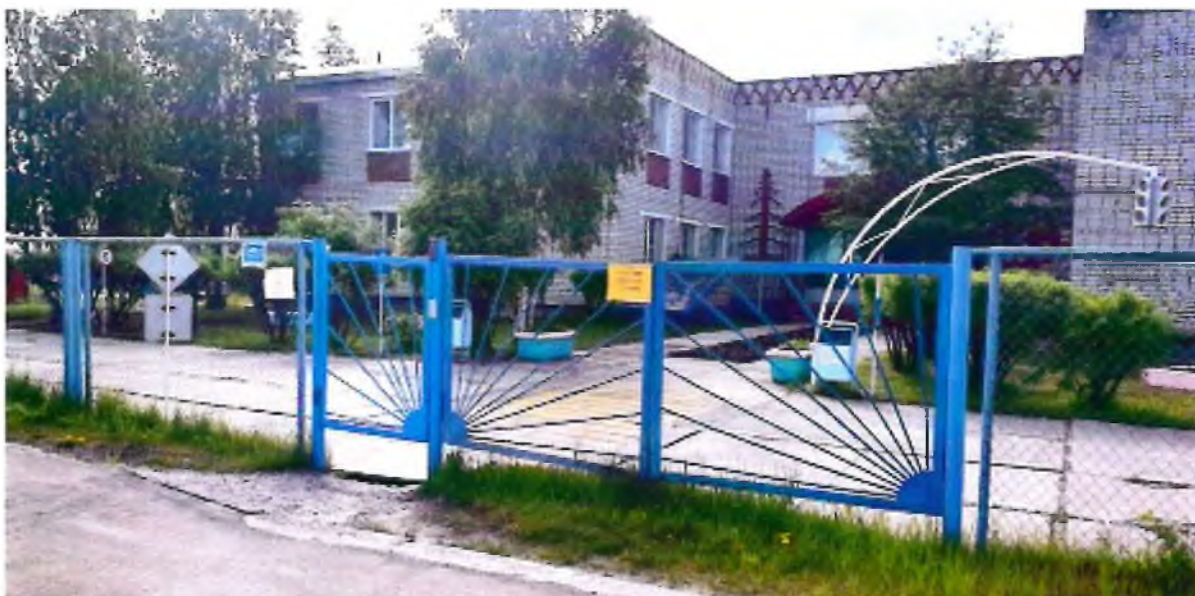
Фото1. Территория, прилегающая к зданию (вход на территорию)