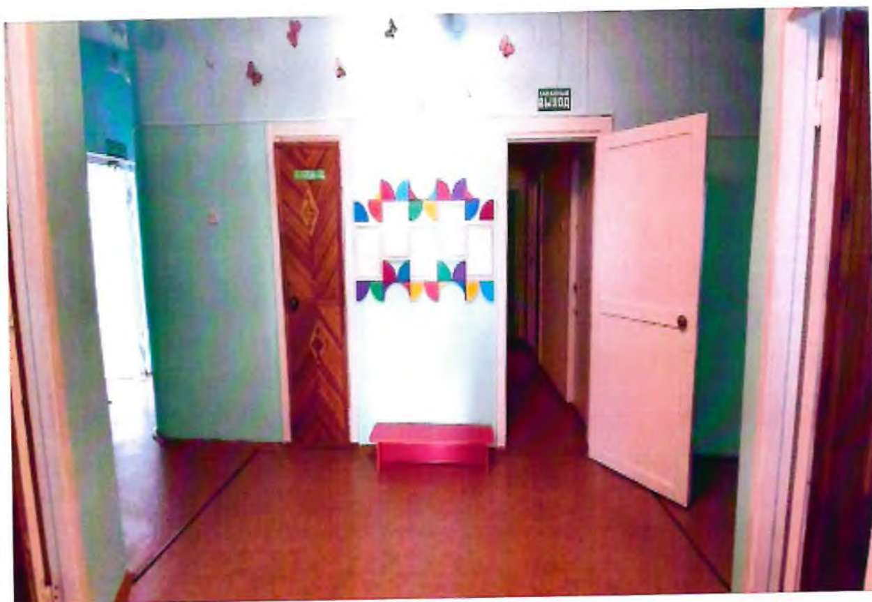
Фото 9. Коридор (вестибюль, зона ожидания)