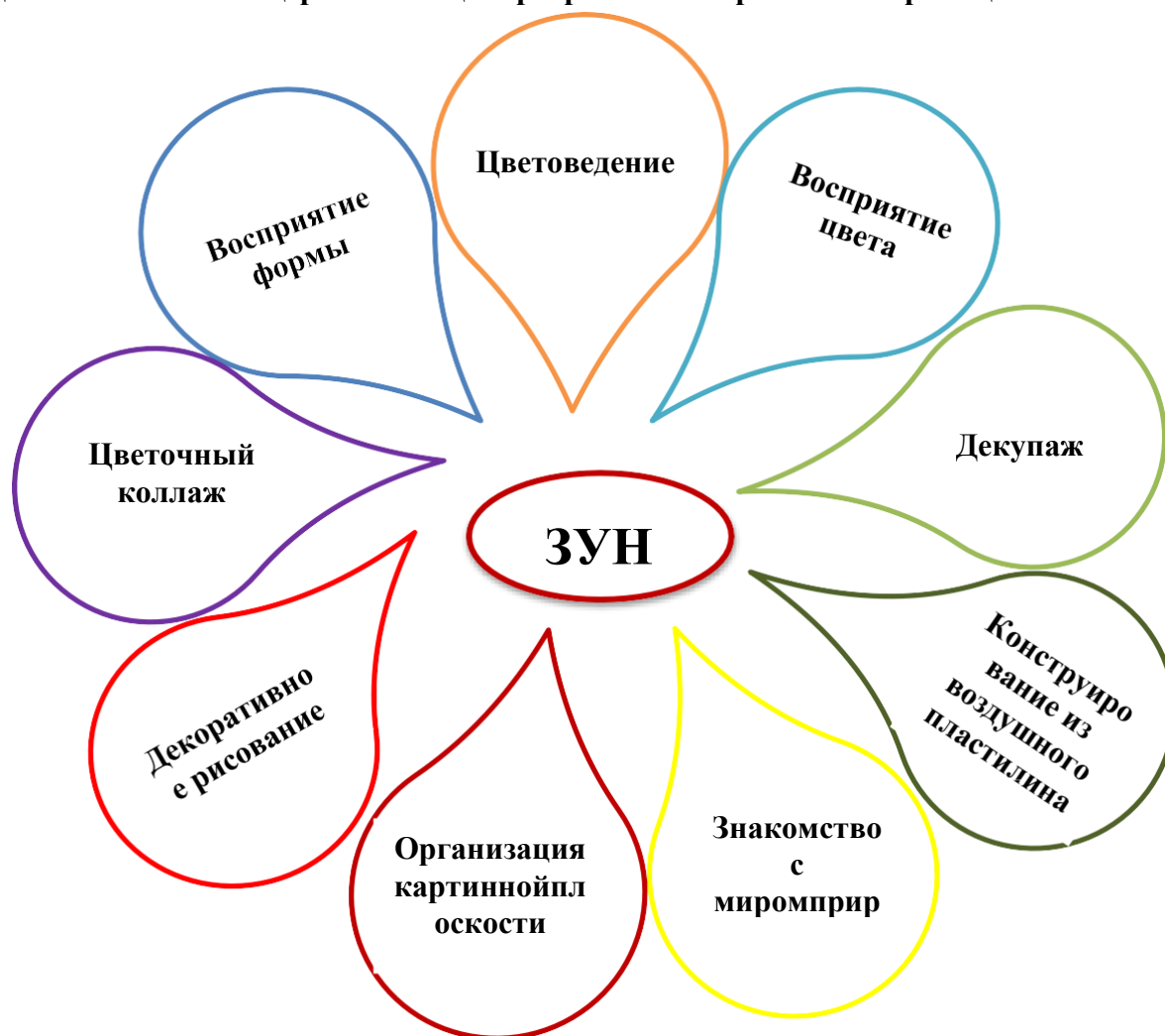
Схема модульного структурирования дополнительной общеразвивающей программы «Творчество без границ»